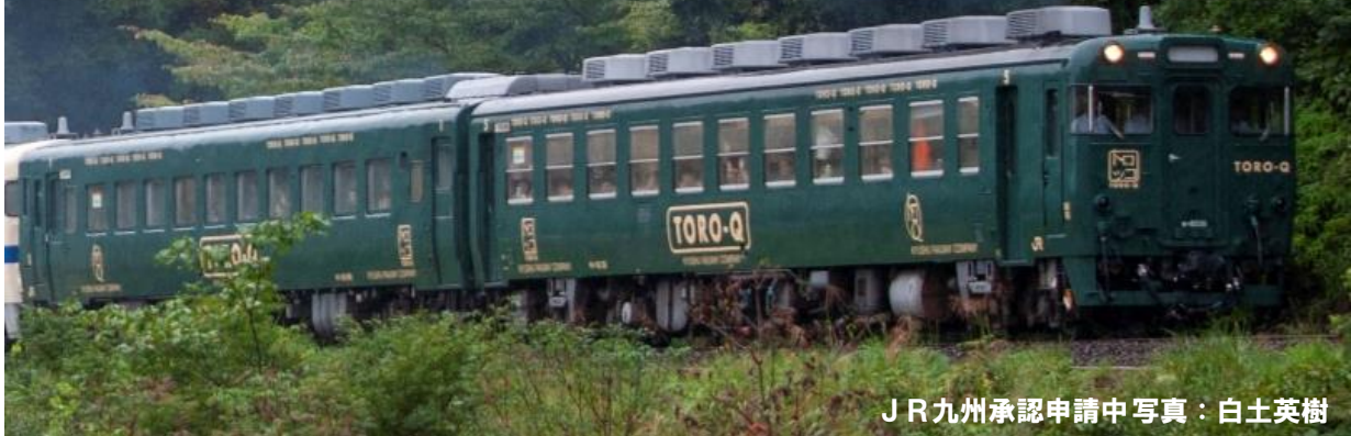
JR九州承認申請中