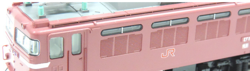
黒Hゴムガラス取付後

コキ104やコキ106で組成される近年のコンテナ編成を牽引する機関車のイメージにピッタリです。 シルバーボディ同士の303号機と304号機の重連運用も見られました。