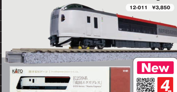
写真はイメージです。JR東日本商品化許諾済