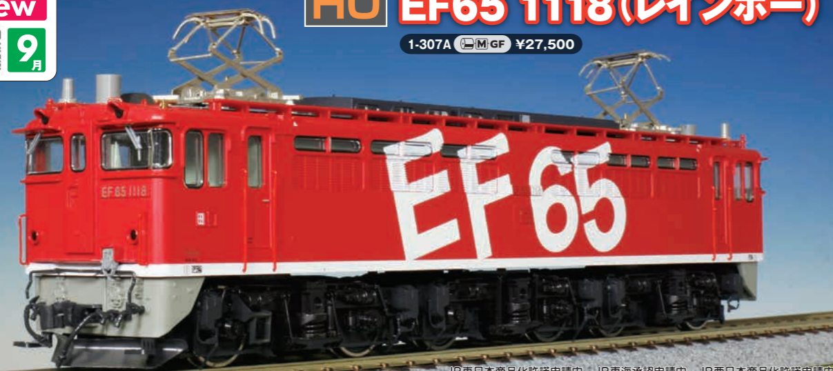
JR東日本商品化許諾申請中 JR東海承認申請中 JR西日本商品化許諾申請中