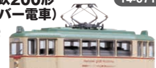
写真は従来製品です。