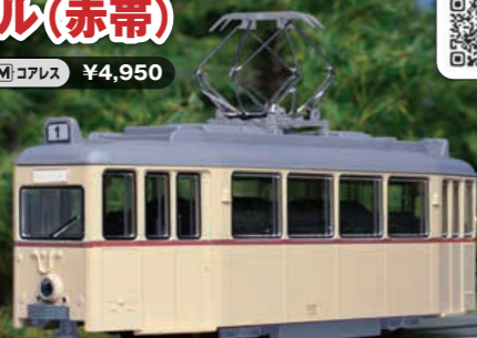
写真は画像加工によるイメージです。