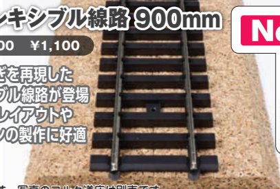
写真は試作品です。写真のコルク道床は別売です。